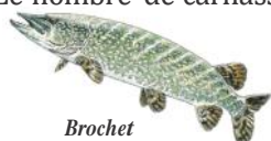
Brochet 60 cm

Le nombre de carnassiers prélevables est fixé à 3 poissons maximum par jour et par pêcheur dont 2 brochets maximum.