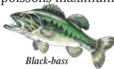
Black-bass 30 c